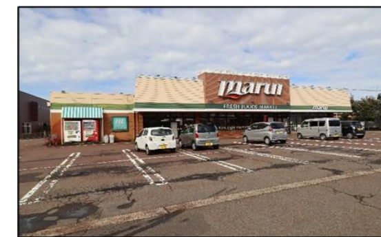
マルイ学校町店 徒歩7分(約560m)