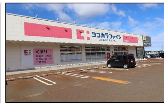
ココカラファイン花園店 車で2分(約900m)