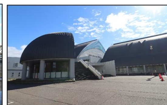
市民体育館 徒歩10分(約800m)