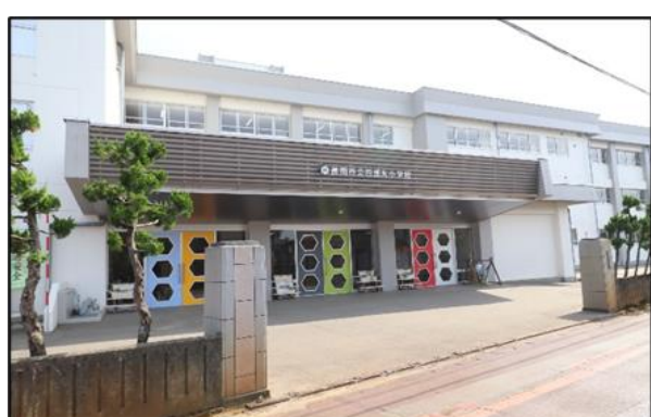
四郎丸小学校 徒歩10分(約800m)