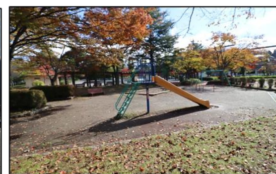
市民文化公園 徒歩10分(約800m)