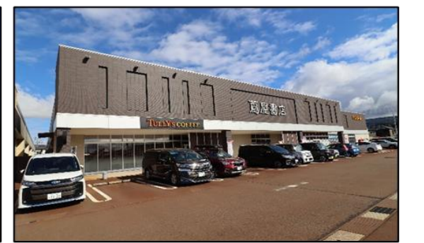
蔦屋書店 花園店 車で2分(約900m)