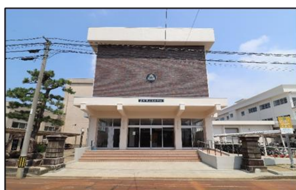
南中学校 徒歩25分(約2,000m)