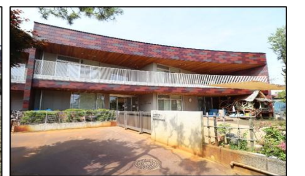
東部マドカ保育園 徒歩8分(約600m)