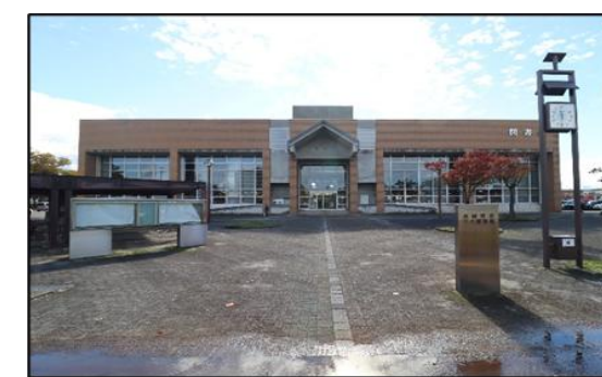
中央図書館 徒歩10分(約800m)