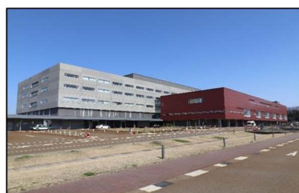
立川病院 車で4分(約1,700m)