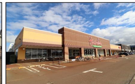
原信 花園店 車で2分(約900m)