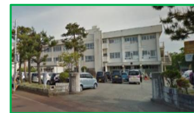
上組小学校 600m(徒歩8分)