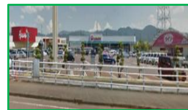
宮内ショッピングセンター 1.7km(車4分)