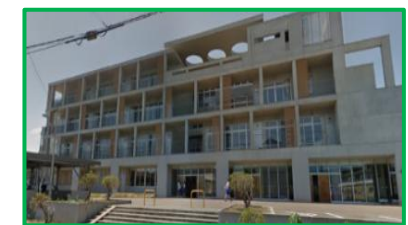
宮内中学校 1.7km(徒歩24分)