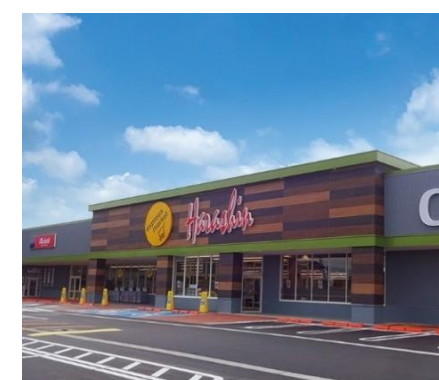
原信 エクスプレスマーケット店 車で4分(約1,300m)