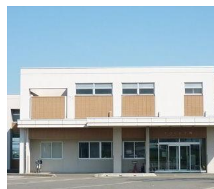
エコトピア寿 徒歩11分(約800m)