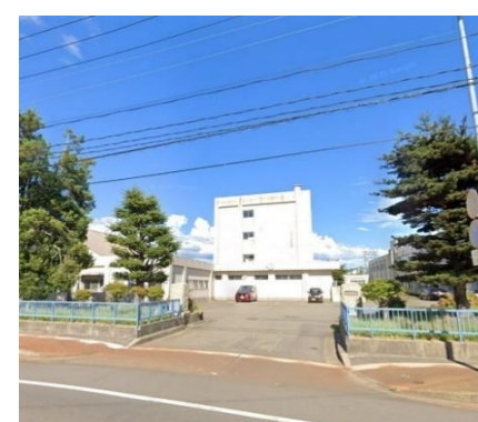
長岡市立北中学校 徒歩10分(約750m)