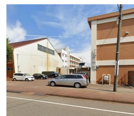
長岡市立新町小学校 徒歩25分(約2,000m)