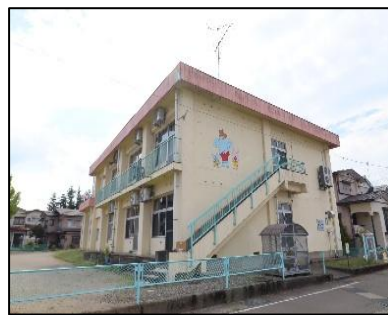
小千谷市立西保育園 徒歩2分(約120m)