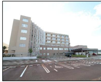
小千谷総合病院 車で8分(約3,000m)