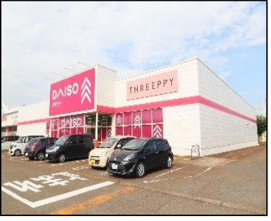
ダイソー小千谷店 車で3分(約900m)