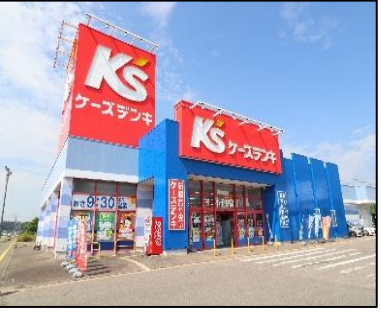
ケーズデンキ小千谷店 車で7分(約2,500m)