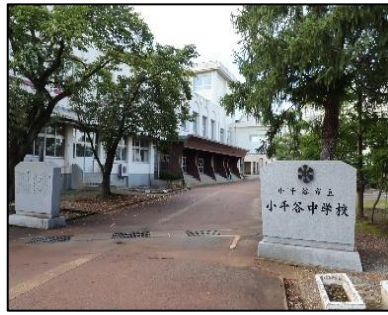
小千谷中学校 徒歩9分(約700m)