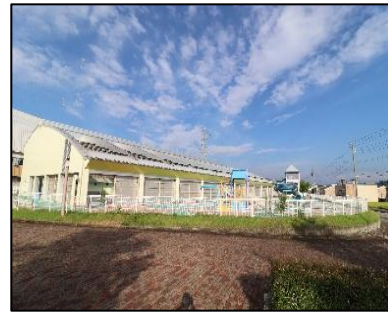
小千谷市民プール 車で5分(約1,500m)