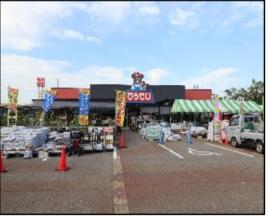
ひらせい小千谷店 車で2分(約600m)