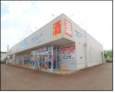
ウエルシア小千谷若葉店 車で2分(約600m)