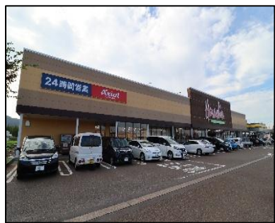
原信 桜町店 車で3分(約900m)