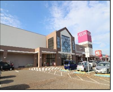
イオン小千谷店 車で7分(約2,500m)