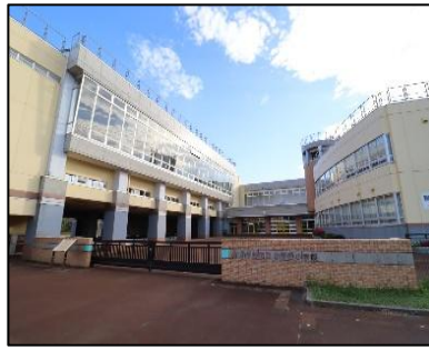
小千谷小学校 徒歩1分(約80m)