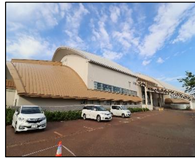
小千谷市総合体育館 車で5分(約1,500m)