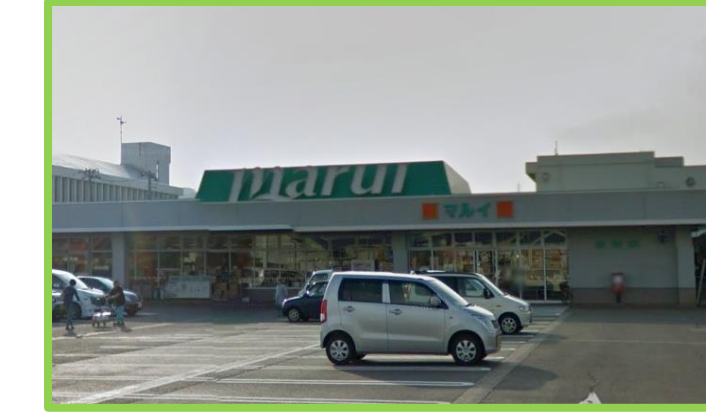
スーパーマルイ与板店 徒歩5分(400m)