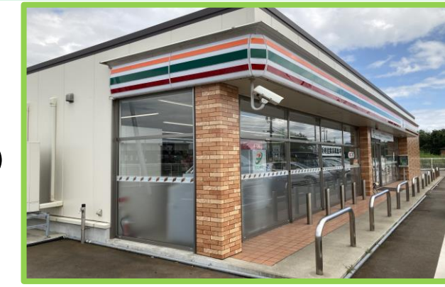
セブンイレブン並柳店 徒歩4分(300m)