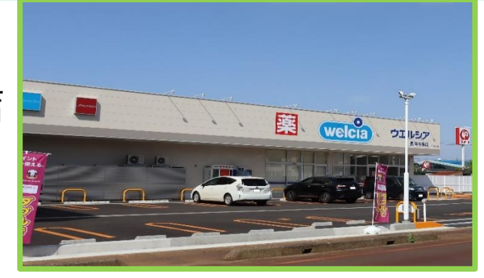
ウェルシア与板店 徒歩6分(450m)