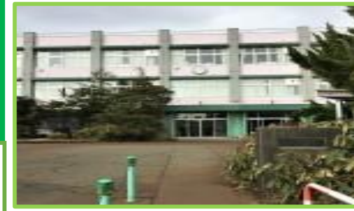
与板小学校 徒歩9分(700m)