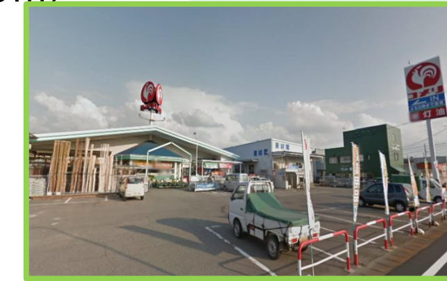
コメリ与板店 徒歩5分(400m)