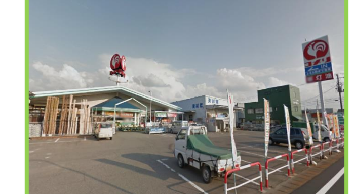
コメリ与板店 徒歩5分(400m)