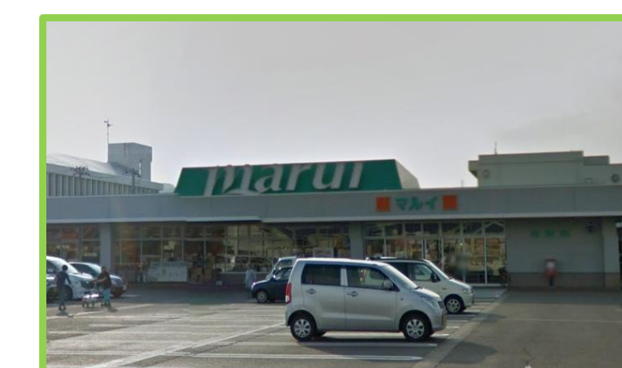
スーパーマルイ与板店 徒歩5分(400m)