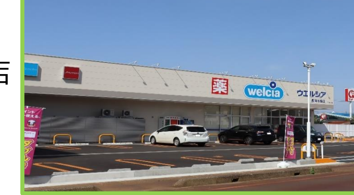
ウエルシア与板店 徒歩6分(450m)