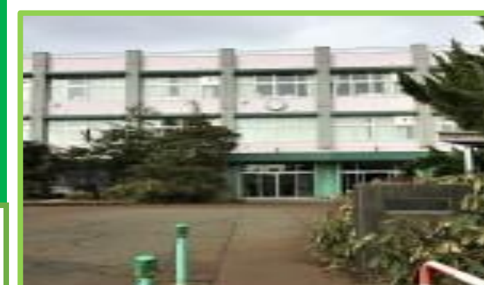
与板小学校 徒歩9分(700m)