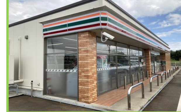
セブンイレブン並柳店 徒歩4分(300m)