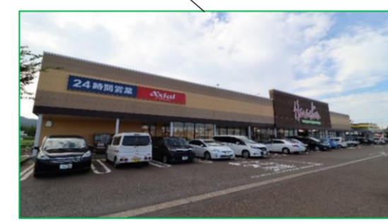
原信 桜町店 車で2分(約800m)