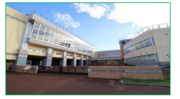
小千谷小学校 徒歩16分(約1,280m)