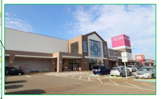
イオン小千谷店 車で5分(約1,700m)