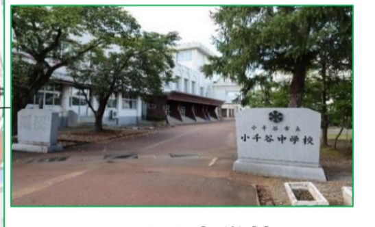
小千谷中学校 徒歩11分(約880m)