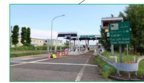
小千谷インター 車で1分(約500m)