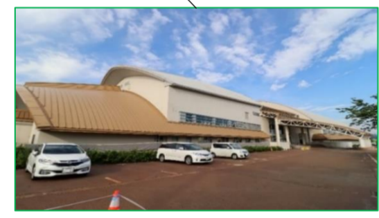
小千谷市総合体育館 徒歩5分(約400m)