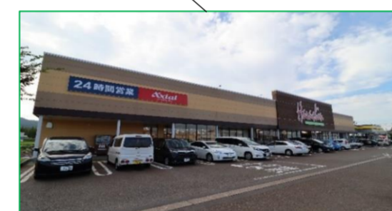
原信 桜町店 車で2分(約800m)