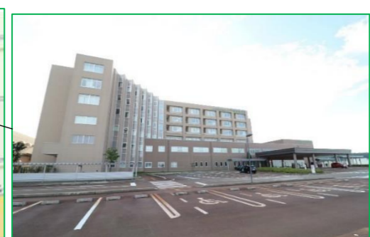
小千谷総合病院 車で5分(約2,000m)