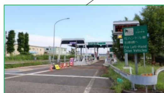
小千谷インター 車で1分(約500m)