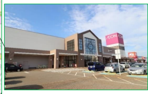
イオン小千谷店 車で5分(約1,700m)