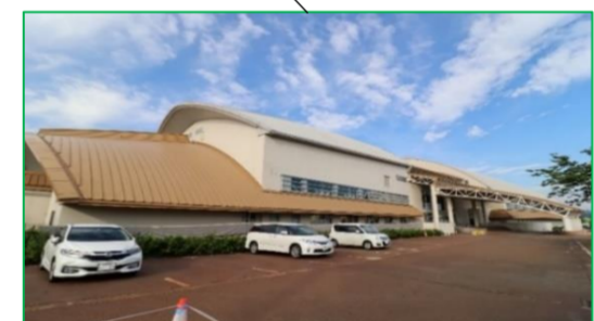
小千谷市総合体育館 徒歩5分(約400m)