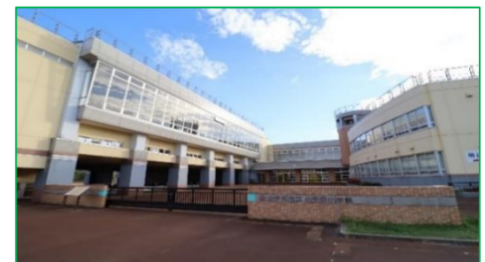
小千谷小学校 徒歩16分(約1,280m)