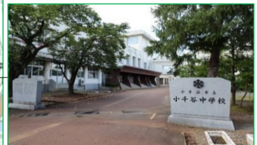
小千谷中学校 徒歩11分(約880m)