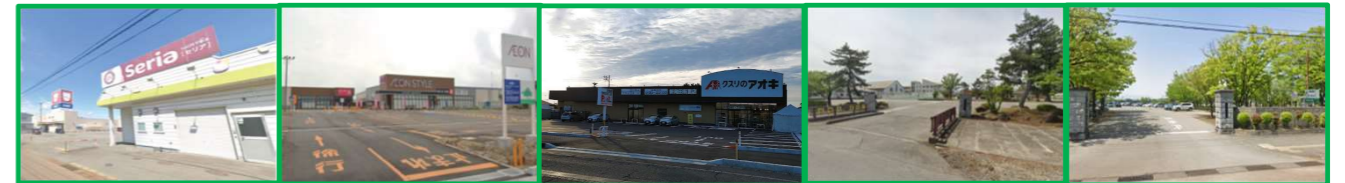
ウオロク セリア イオンスタイル ダイソー クスリのアオキ 二葉小学校 本丸中学校 徒歩6分(約450m) 徒歩5分(約350m) 徒歩5分(約400m) 徒歩9分(約650m) 徒歩7分(約500m)