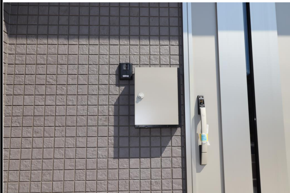
モニターフォン・メールボックス