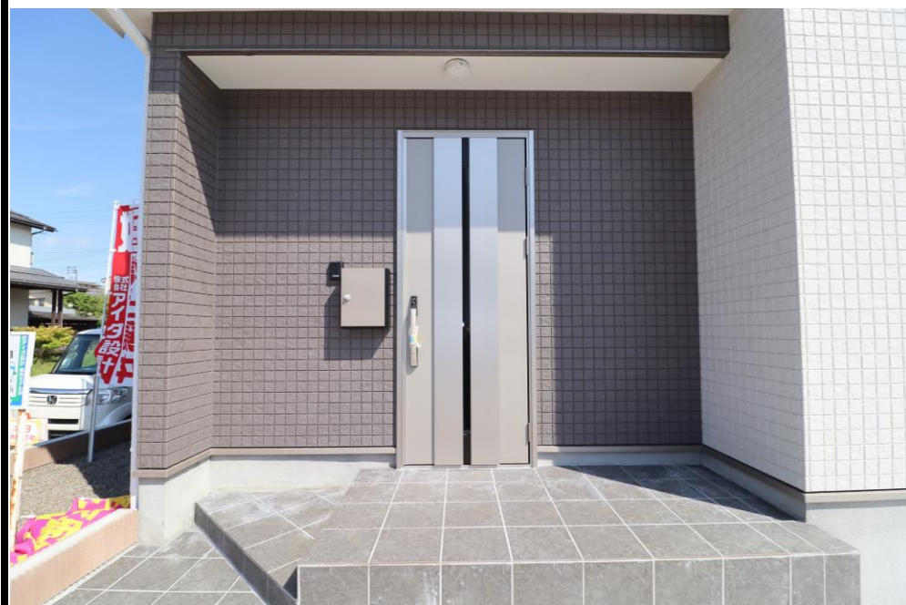
玄関 (キーレス対応)