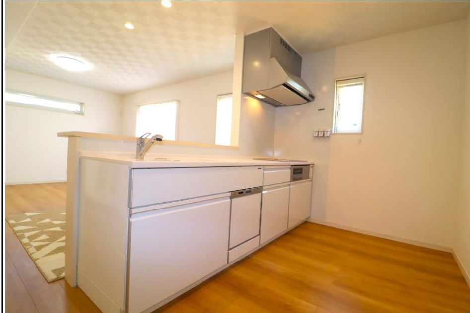
キッチン (IHコンロ、食洗器付き)