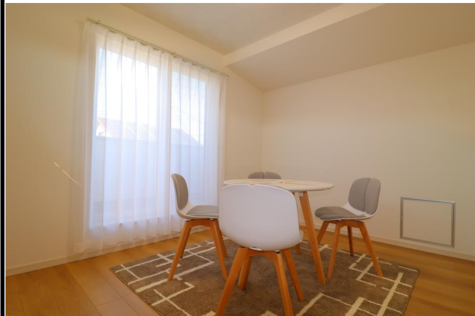
2階プラスリビング