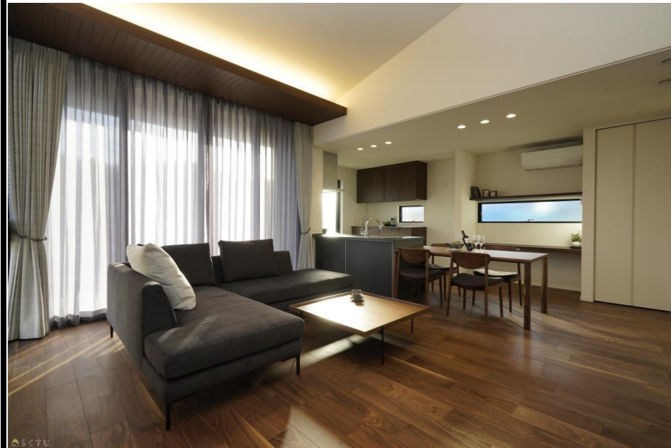
リビング・ダイニング・キッチン