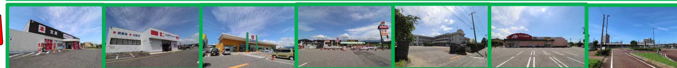
ダイソー 徒歩約2分(約120m) | ココカラファイン 徒歩約9分(約650m) | ウオロク 徒歩約14分(約1.0km) | ひらせい 徒歩約12分(約850m) | 東豊小学校 徒歩約15分(約1.1km) | クスリのアオキ 徒歩約8分(約550m) | 新発田駅 徒歩約12分(約850m)