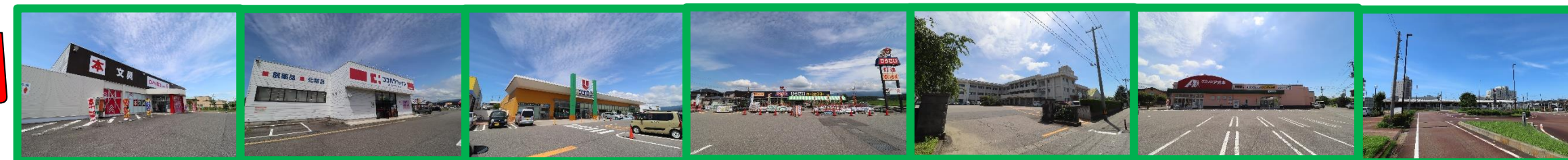
ダイソー 徒歩約2分(約120m) | ココカラファイン 徒歩約9分(約650m) | ウオロク 徒歩約14分(約1.0km) | ひらせい 徒歩約12分(約850m) | 東豊小学校 徒歩約15分(約1.1km) | クスリのアオキ 徒歩約8分(約550m) | 新発田駅 徒歩約12分(約850m)