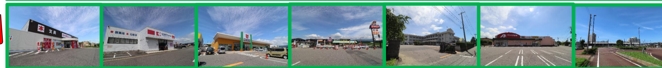
ダイソー 徒歩約2分(約120m) | ココカラファイン 徒歩約9分(約650m) | ウオロク 徒歩約14分(約1.0km) | ひらせい 徒歩約12分(約850m) | 東豊小学校 徒歩約15分(約1.1km) | クスリのアオキ 徒歩約8分(約550m) | 新発田駅 徒歩約12分(約850m)