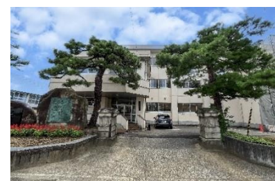
長岡市立西中学校 徒歩8分(約610m)