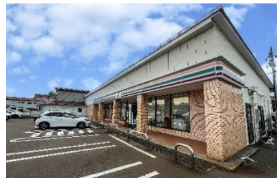
セブンイレブン 長岡市立劇場前店 徒歩5分(約350m)