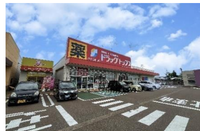
ドラッグトップス千歳店 徒歩6分(約480m)