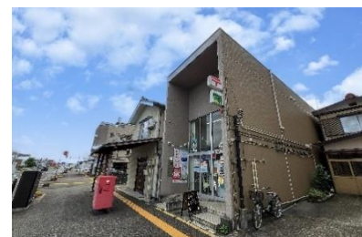
宮原 郵便局 徒歩2分(約140m)