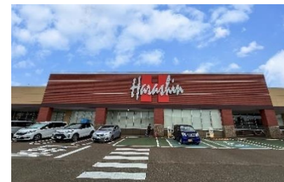
原信シビックコア店 徒歩6分(約480m)