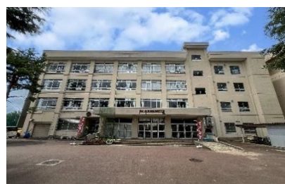
長岡市千手小学校 徒歩8分(約625m)