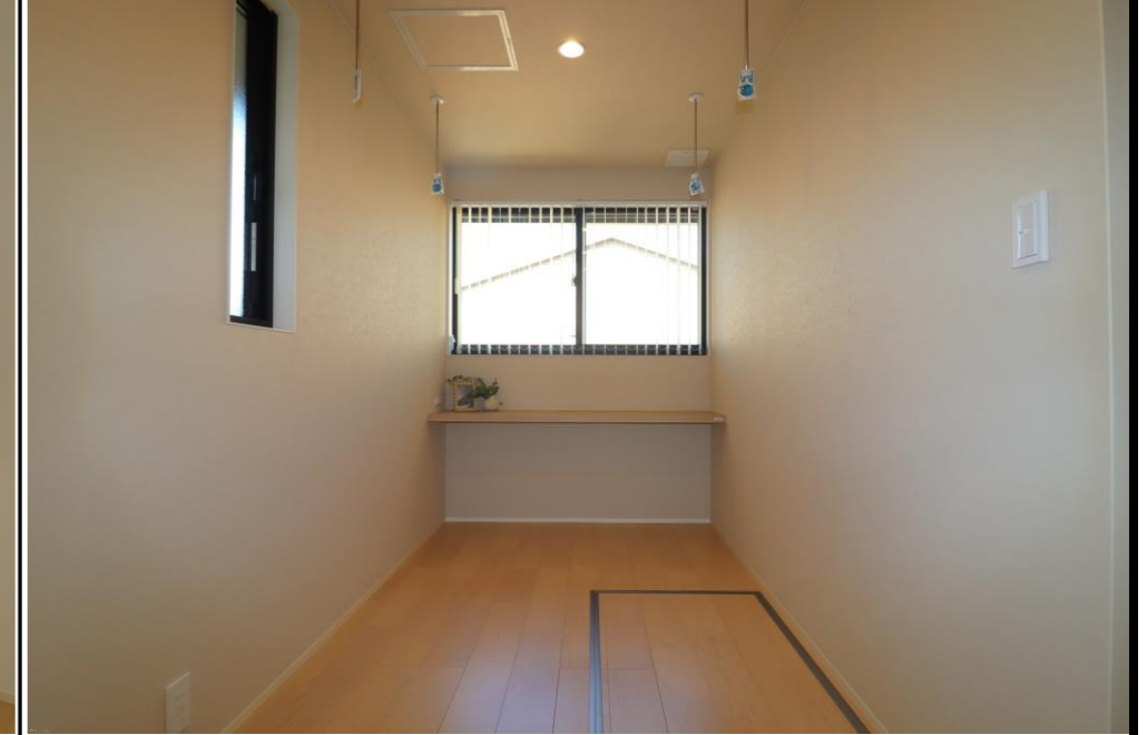
2階ホールカウンター