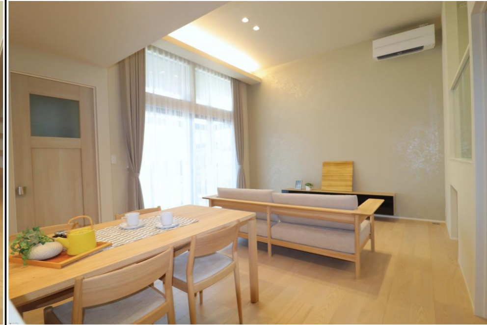
ダイニング・リビング