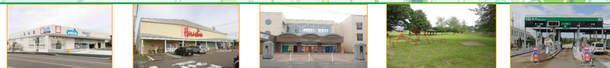
ウエルシア 徒歩3分(約210m)