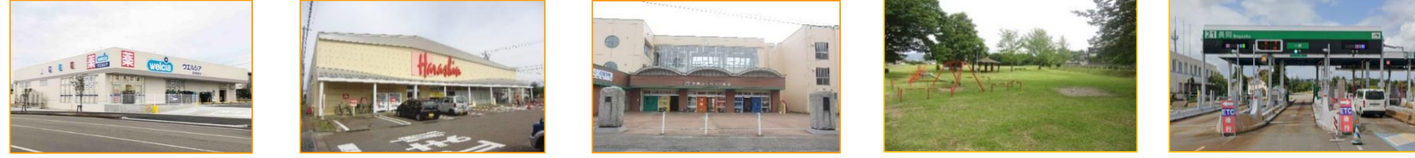
ウエルシア 徒歩3分(約210m) | 原信 関原店 徒歩5分(約350m) | 日越小学校 徒歩25分(約1,00m) | 五荘山公園 徒歩1分(約80m) | 長岡インター 車で3分(約1,600m)