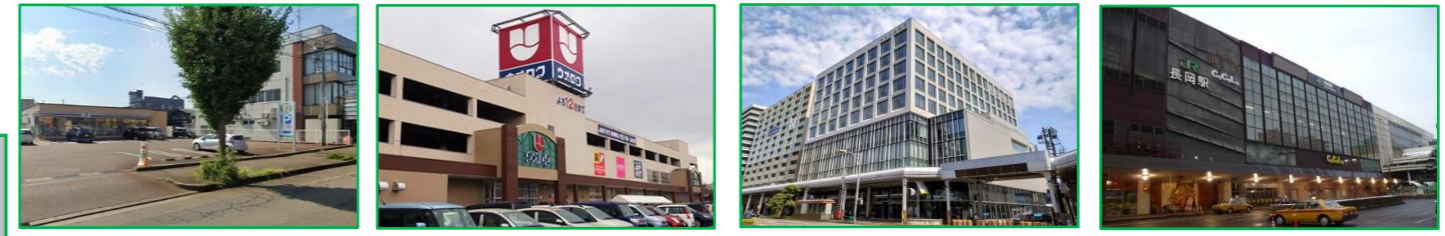
セブンイレブン 西千手店 350m ウオロク 長岡店 750m ミライエ長岡 1,000m 長岡駅 1,400m