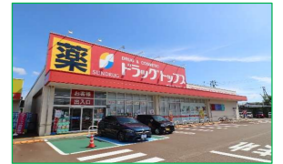
ドラックトップス千歳店 車で4分(約1,200m)