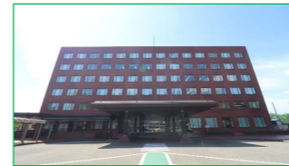
さいわいプラザ 徒歩5分(約400m)