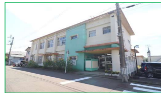
三和保育園 徒歩5分(約400m)