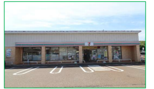
セブンイレブン市立劇場前 徒歩4分(約280m)