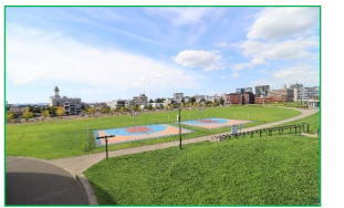
長岡市民防災公園 車で4分(約1,200m)