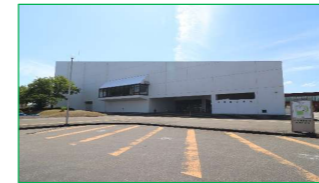
長岡市立劇場 徒歩5分(約400m)