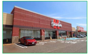
原信 シビックコア店 車で4分(約1,200m)