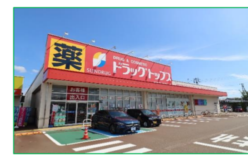
ドラックトップス千歳店 車で4分(約1,200m)