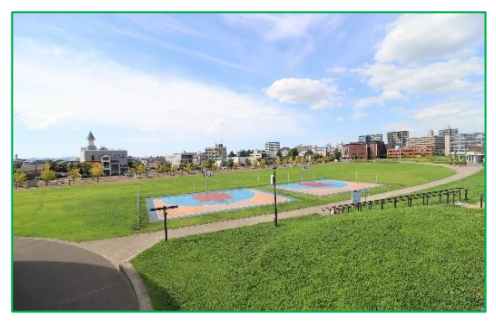
長岡市民防災公園 車で4分(約1,200m)