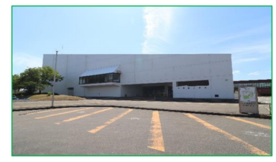
長岡市立劇場 徒歩5分(約400m)