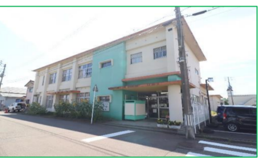
三和保育園 徒歩5分(約400m)