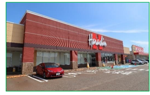
原信 シビックコア店 車で4分(約1,200m)