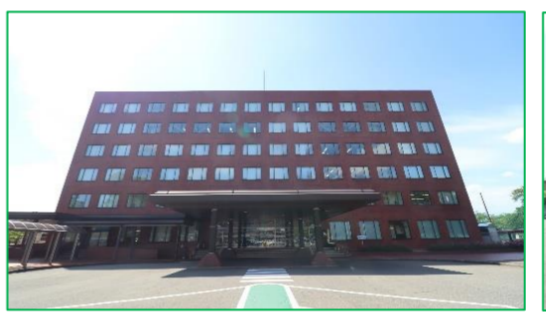
さいわいプラザ 徒歩5分(約400m)