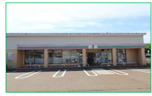
セブンイレブン市立劇場前 徒歩4分(約280m)