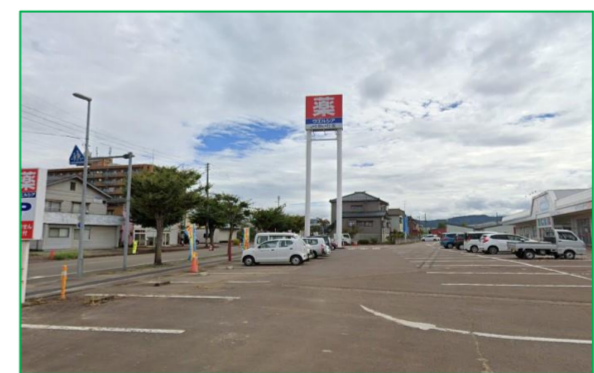
ウエルシア 泉店 徒歩5分 (350m)