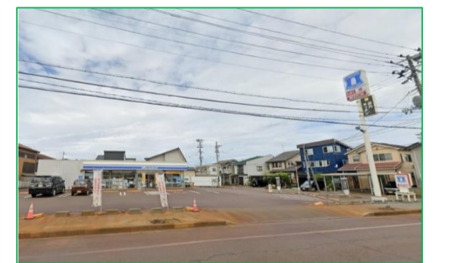
ローソン 石内店 徒歩8分 (約600m)