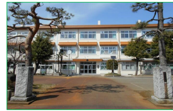
新町小学校 徒歩5分 (350m)