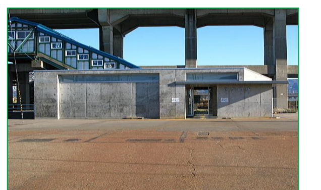
北長岡駅 徒歩10分 (750m)