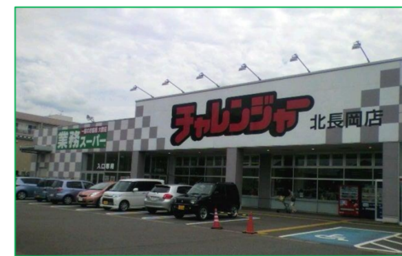
チャレンジャー 北長岡店 徒歩4分 (300m)