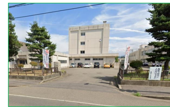
北中学校 徒歩10分 (800m)