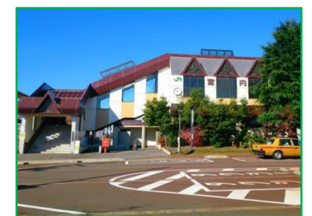
宮内駅 徒歩13分 (1,000m)