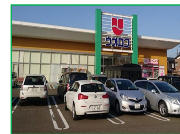
ウオロク 要町店 徒歩8分 (550m)