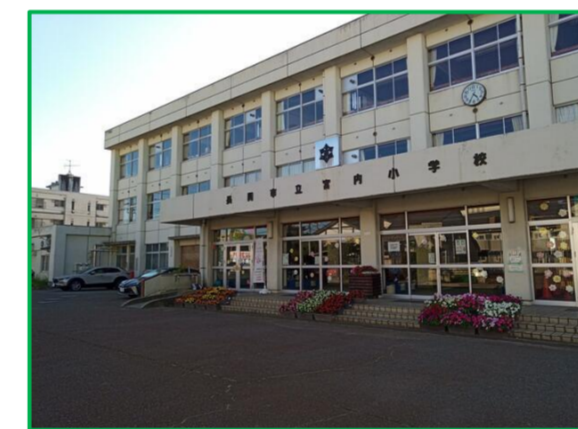
宮内小学校 徒歩10分 (700m)