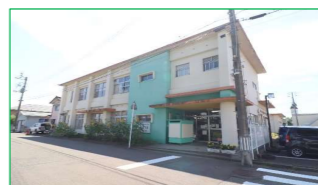
三和保育園 徒歩5分(約400m)