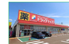
ドラックトップス千歳店 車で4分(約1,200m)