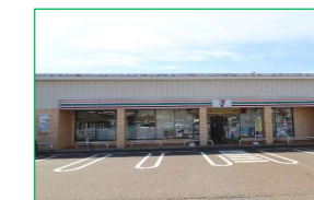
セブンイレブン市立劇場前 徒歩4分(約280m)