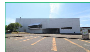
長岡市立劇場 徒歩5分(約400m)