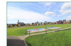
長岡市民防災公園 車で4分(約1,200m)