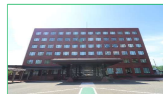
さいわいプラザ 徒歩5分(約400m)