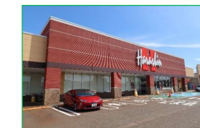
原信 シビックコア店 車で4分(約1,200m)